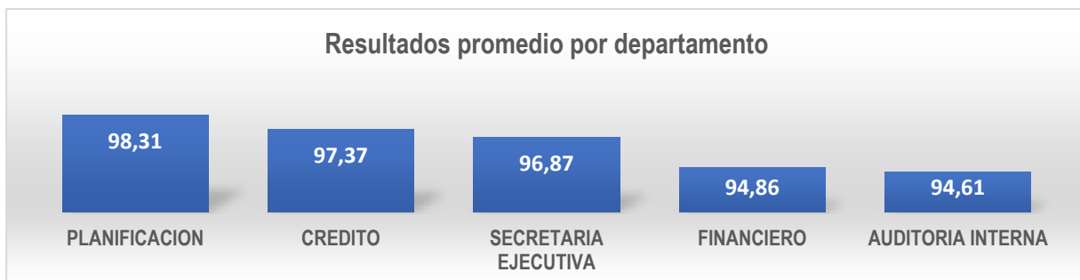
Grafico 1: Resultados promedio por departamento