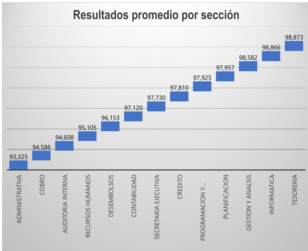
Grafico 2: Resultado promedio por sección