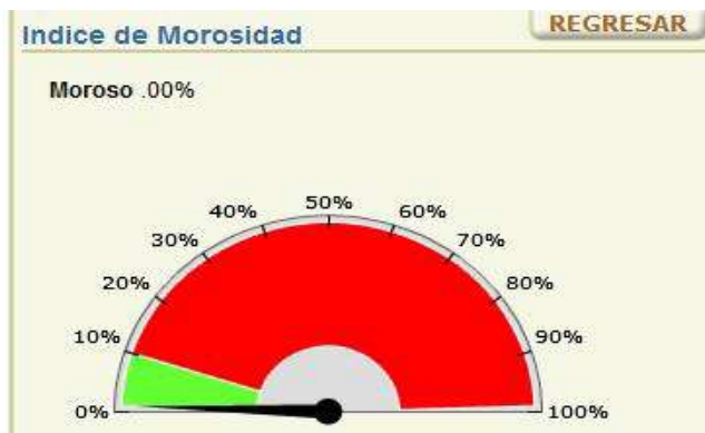
Sistema de información gerencia, Cuadro 3.