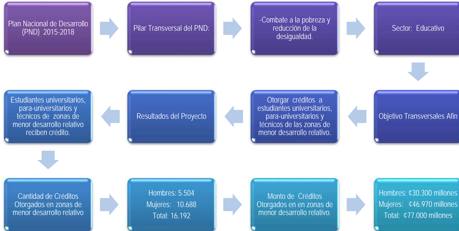
Gráfica 1: Vinculación PND 2015-2018 con las Metas Institucionales