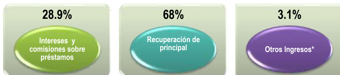
Ilustración 2: Porcentaje de Participación de los Ingresos Recibidos en el IV Trimestre de 2018

La ilustración Nº 2 muestra el porcentaje de participación que representan los diferentes rubros de ingresos en relación con los ingresos totales. El detalle es el siguiente: