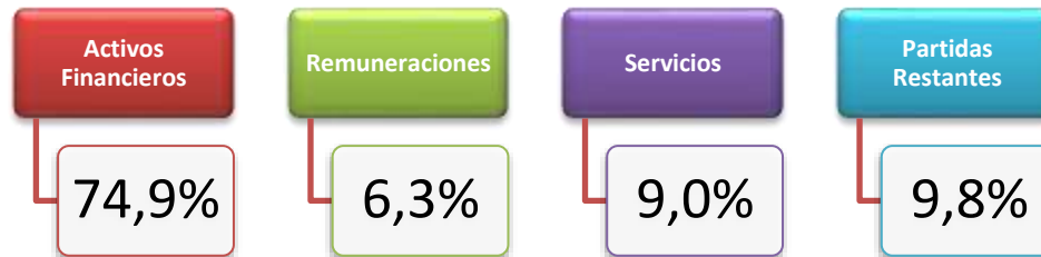
Ilustración 4: Porcentaje de Participación de los Egresos realizados en el IV Trimestre de 2018

Como se puede observar, la institución hizo una adecuada asignación de los recursos presupuestarios en el IV Trimestre de 2018, donde dedica el 74,9% de los mismos a la función sustantiva institucional, dado que el total de egresos en ese período fue ¢7.399 millones y la cifra de desembolsos a estudiantes fue de ¢5.542 millones.