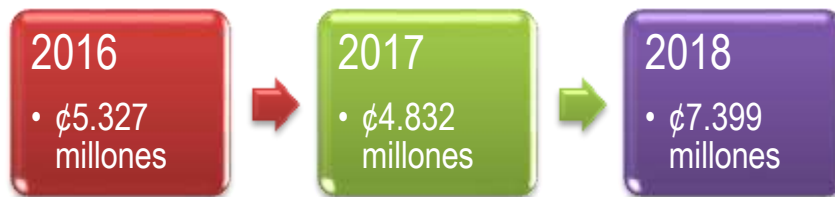
Ilustración 3: Egresos efectivos totales, 2016- 2018

El monto de los egresos en el IV Trimestre de 2018, ascendió a ¢7.399 millones , la comparación de los egresos para el mismo periodo del 2017-2018, (¢4.832 millones) muestra un crecimiento del 53.1% , generado principalmente por el aumento en los activos financieros.