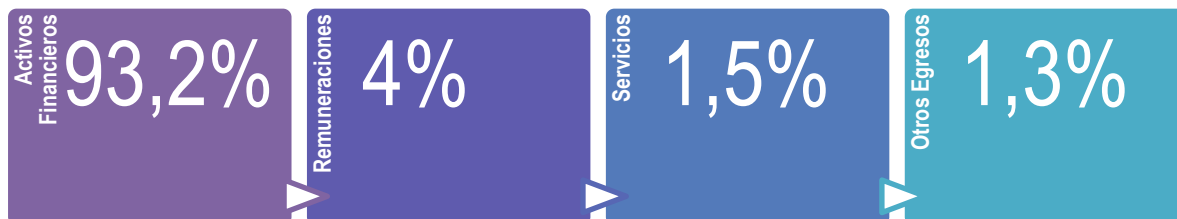
Ilustración 4: Porcentaje de Participación de los Egresos realizados en el I Trimestre del 2019

Lo anterior demuestra que la institución hizo una adecuada asignación de los recursos presupuestarios en el I Trimestre del 2019, donde dedica el 93,2% de los mismos a la función sustantiva institucional, dado que el total de egresos en ese período fue ¢11.859 millones y la de cifra de desembolsos a estudiantes fue de ¢11.050 millones .