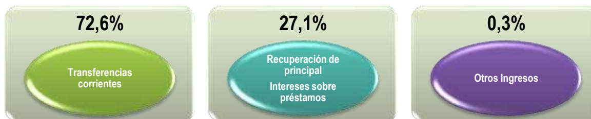
Ilustración 1: Porcentaje de participación de los ingresos recibidos en el I Trimestre de 2020

La ilustración N° 1 muestra el porcentaje de participación que representan los diferentes rubros de ingresos en relación con los ingresos totales. El detalle es el siguiente: