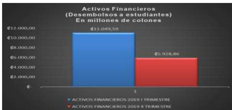
Gráfico 1: Activos Financieros (Desembolsos a Estudiantes) I Trimestre- II Trimestre 2019

Los desembolsos a estudiantes absorbieron el 87.7% del total de egresos del trimestre, el cual alcanzó la cifra de ¢5.929 millones . El porcentaje de ejecución específico del segundo trimestre es de 21% lo que se debe a que en el primer trimestre se desembolsó la mayor cantidad de préstamos programados por tratarse del inicio del periodo lectivo, donde se desembolsa tanto a estudiantes en periodo cuatrimestral como semestral. Este egreso atiende la función sustantiva de la institución.