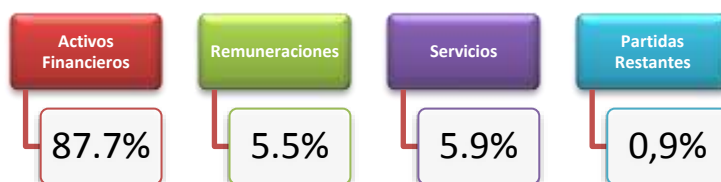
Ilustración 2: Porcentaje de participación de los egresos realizados en el II Trimestre de 2019

Como se puede observar, la institución hizo una adecuada asignación de los recursos presupuestarios en el II Trimestre de 2019, donde dedica el 87,7% de los mismos a la función sustantiva institucional, dado que el total de egresos en ese período fue ¢6.760 millones y la de cifra de desembolsos a estudiantes fue de ¢5.929 millones.