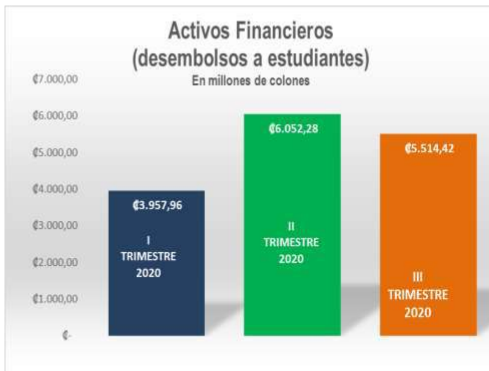
Gráfico 1: Activos Financieros (Desembolsos a Estudiantes) Por trimestre 2020

Este año la ejecución de desembolsos se ha visto afectada, debido a la crisis económica y sanitaria que enfrenta el país por el Covid-19, ya que muchos estudiantes decidieron congelar sus estudios mientras normalizan su situación económica y universitaria. Además, que no todos los estudiantes se han adaptado a la modalidad virtual.