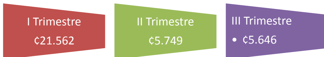
Ilustración 1: Ingresos efectivos al 30 de Setiembre 2020

El comportamiento de las partidas de ingresos al 30 de Setiembre de 2020 fue el siguiente: