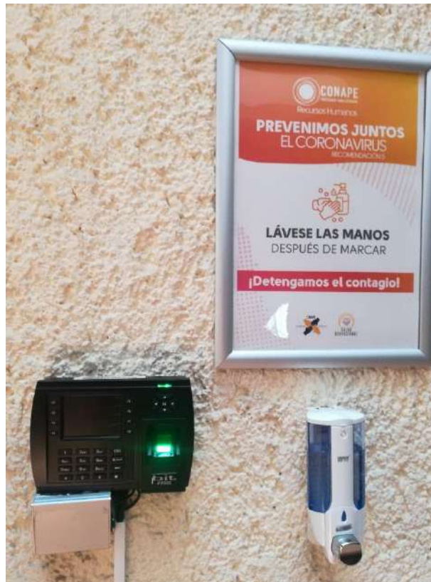
Fotografía tomada en el edificio central

Instrucción a todo el personal para que procedan con el lavado de manos inmediatamente después de marcar en el reloj marcador