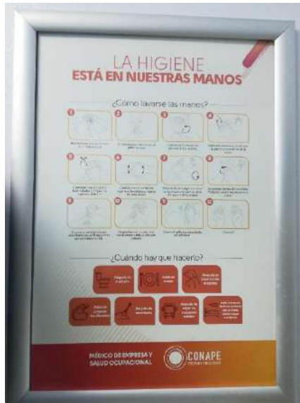
Fotografía tomada en el baño de mujeres del edificio anexo este.

Una vez dada la alerta amarilla se procedió a colocar mayor rotulación con el fin de fortalecer las medidas de prevención, dentro de la rotulación que se coloca se encuentra la siguiente: