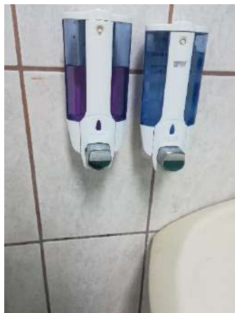
Fotografía tomada en los baños del edificio anexo este