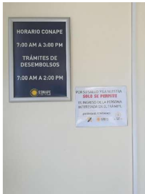
Fotografía tomada en la entrada al edificio anexo este

Se restringe el ingreso de personas que acompañas a los trámites para evitar la aglomeración de personas en el edificio