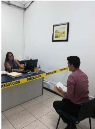
Imagen tomada en el edificio anexo este