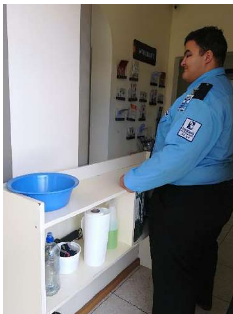
Fotografía tomada en la entrada del edificio anexo este