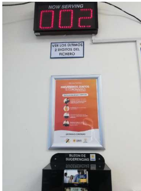
Fotografía tomada en el edificio anexo este en atención al público.

Recomendación para el público sobre la forma correcta de toser y estornudar