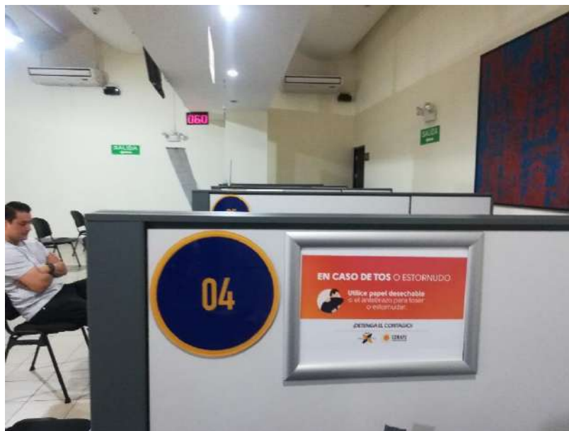
Fotografía tomada en el área de Desembolsos