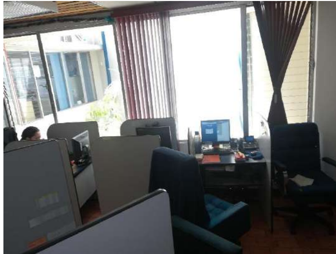
Fotografía tomada en el edificio central