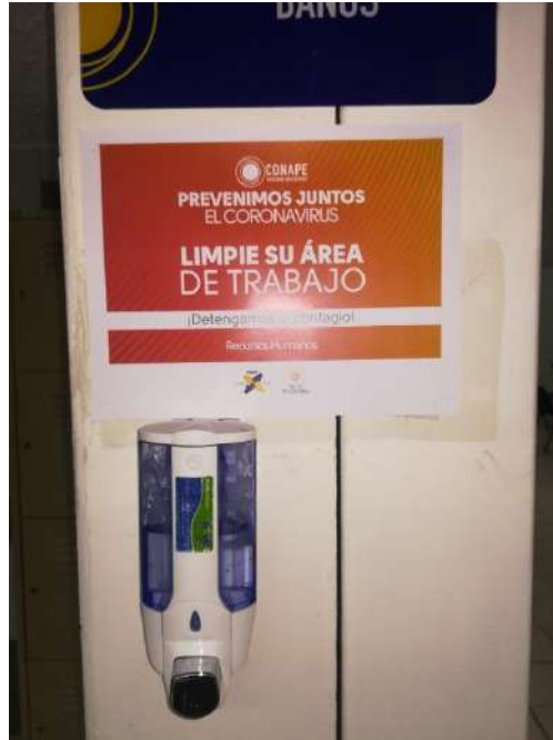
Fotografía tomada en el edificio central

Dispensadores de alcohol en gel ubicados en distintas áreas comunes para el personal y para los clientes