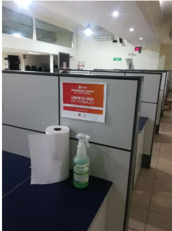
Fotografía tomada en la sección de Desembolsos