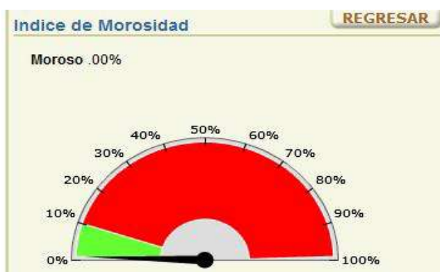
Sistema de información gerencia, Cuadro 3.