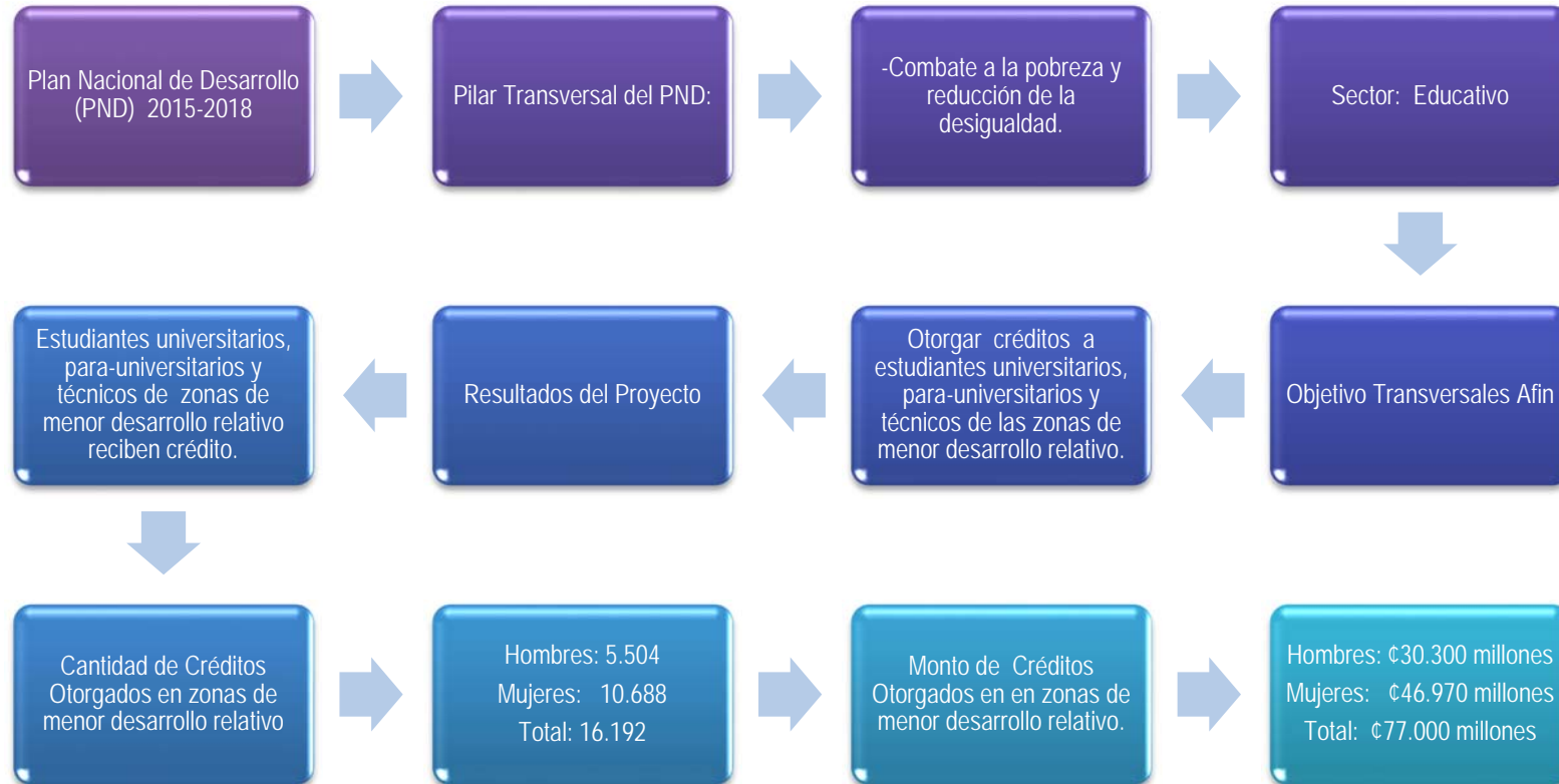
Gráfica 1: Vinculación PND 2015-2018 con las Metas Institucionales